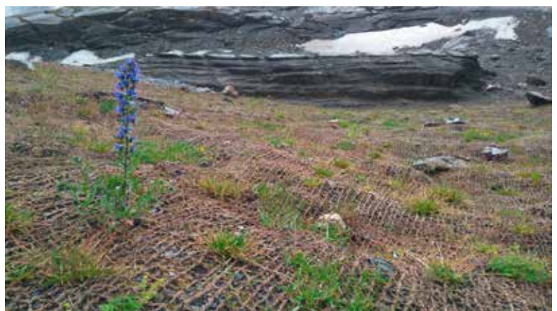
Rekultivierte Fläche mit Pflanzung und Abdeckung im Bereich der ehemaligen Bergstation, links vorne der gewöhnliche Nattertkopf – Echium vulgare. (AUE)

Von den gut 2 200 gepflanzten Pflanzen konnten im Jahre 2015 85 % und im Jahre 2020 immer noch 82,5 % gefunden und als gut wachsend beurteilt