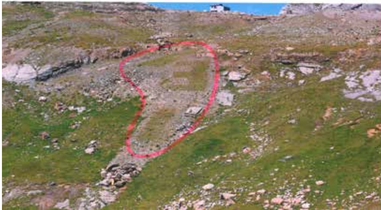
Die Versuchsflächen aus dem Jahre 2011 sind in der Landschaft immer noch gut sichtbar. (AUE)

werden. Die Überlebensrate hat von Art zu Art stark geschwankt, ist aber generell sehr hoch. Der Deckungsgrad der Pflanzen hat auf allen Flächen zwischen 2015 und 2020 deutlich zugenommen. Bei den angesäten Flächen ohne Abdeckung beispielsweise stieg er von 56,2% im Jahre 2015 auf 77,6% im Jahre 2020. Das ist für eine 8 bis 9-jährige Rekultivierung auf 2400 müM auf einem nach der Bautätigkeit völlig neu aufgebauten Untergrund ohne Ober- und Unterboden ein sehr hoher Wert.