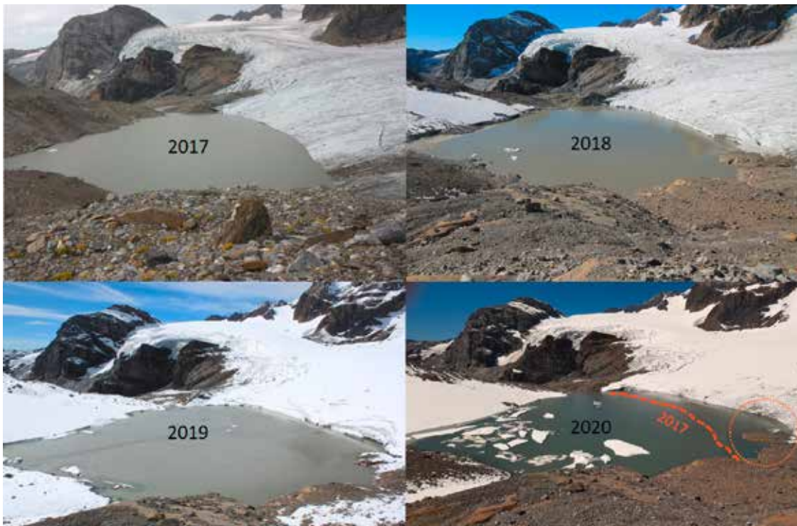
Veränderung des Gletschersees (Stern in Abb. 1) am Fusse des Claridengletschers zwischen 2017 und 2020.

erst im letzten Jahrzehnt gebildet. Seit 2017 hat sich seine Fläche eindeutig vergrößert. Der Gletscher hat sich zurückgezogen und der See wurde grösser (Abb.2). Das Abschmelzen der Gletscher lässt aber nicht nur neue Seen in Vertiefungen entstehen, sondern hat auch Auswirkungen auf die Biodiversität.