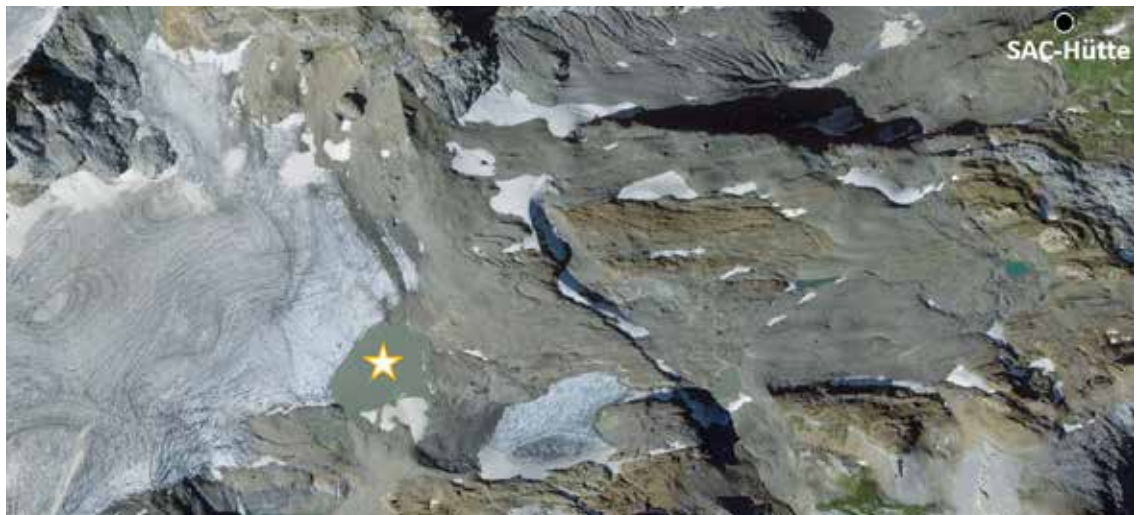
Luftbild Claridenfirn (links im Bild) und Gletschervorfeld mit mehreren Gletscherseen. Stern = See in Abbildung 2.

scher stärker ab. Dies erfolgt auch beim Claridengletscher. Seine Masse nimmt seit Ende der 1980er-Jahre kontinuierlich ab. An seinem Fuss haben sich mehrere Gletscherseeli gebildet (Abb. 1). Einer davon liegt auf einer Höhe von 2586 Metern über Meer. Er hat sich