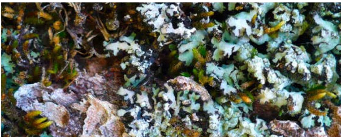
Phaeophyscia hispidula kommt typischerweise auf Moos an der Borke von alten Bergahornen vor.