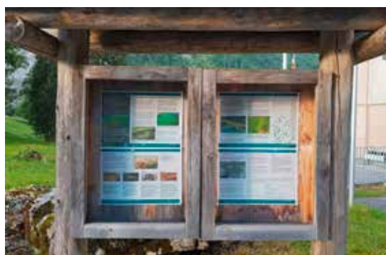
Der Schaukasten beim Berghotel mit vier neuen Informationsblätter (AUE)

heimischen Wasserpflanzen verdrängt. Das zahlreiche Auftreten dieser Pflanze verursacht auch Nutzungskonflikte mit der Wasserkraftnutzung und dem Tourismus. Die Verschleppung der Wasserpest in andere Glarner Gewässer soll dringend vermieden werden. Deswegen werden die Besucher insbesondere in Bezug auf dieses Thema sensibilisiert. Lara Hofmann