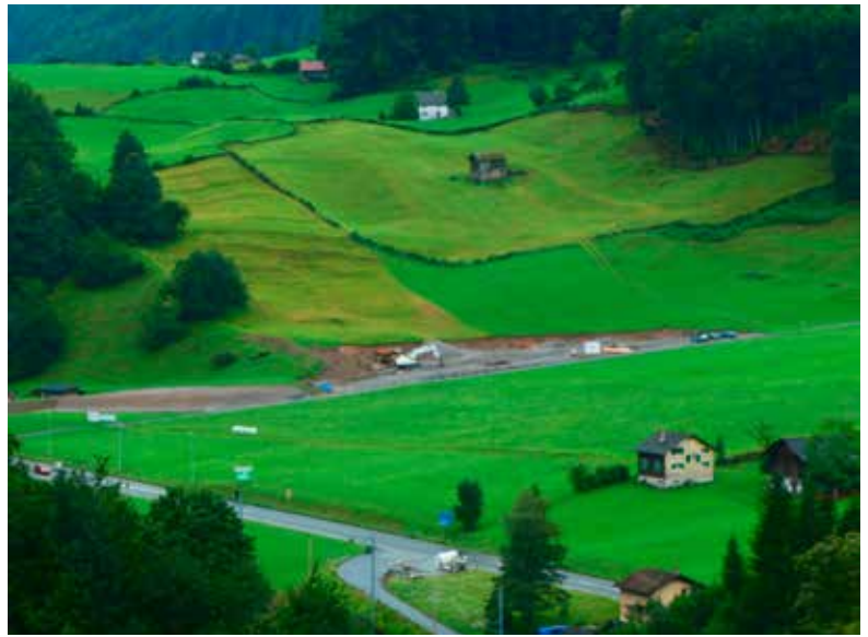
Am neuen Deponie-Standort Däniberg wurde im August 2020 eine erste Etappe abhumisiert und steht für die Auffüllung bereit.