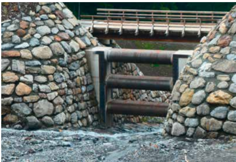
Beim Bau neuer Geschiebesammler wird darauf geachtet, dass feinkörniges Geschiebe weitergeleitet werden kann.

Für die Gemeinden wurden mögliche Ablagerungsorte gesucht und für die Gemeinde Glarus Nord Standorte in 5 Geländekammern, für Glarus in 3 und für Glarus Süd in 11 vorgeschlagen. Die Gemeinden haben diese Standorte weiterbearbeitet und wollen diese in ihre Nutzungsplanungen aufnehmen. Anschliessend werden die baurechtlichen Voraussetzungen für die Nutzung dieser Ablagerungsorte im Ereignisfall vorbereitet. Die Gemeinde Glarus Nord hat diese Vorarbeiten am weitesten vorangetrieben und hat die Standorte im NUP2 aufgenommen. Die Absicht der Gemeinden ist es, diese Standorte zu sichern. Damit soll im Ereignisfall klar sein, wo welches Material abgelagert wird. Auch alle formalen Voraussetzungen für eine Ablagerung sollen damit vorzeitig geregelt werden.