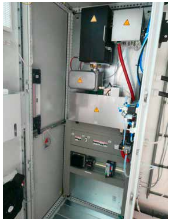
Die Messeinrichtung zur Bestimmung der Quecksilberkonzentration in der Abluft (AUE)

Quecksilber ist ein für Mensch und Umwelt gefährlicher Stoff, dessen Verwendung heute in den meisten Bereichen verboten ist. Trotzdem gibt es in alten Geräten, Thermometern, Medikamenten, Sportplatzbelägen oder Batterien noch beträchtliche Mengen an Quecksilber, die manchmal bewusst oder unbewusst in den Abfall gelangen können. Kehrichtverbrennungsanlagen (KVAs) sind darum mit aufwändigen Einrichtungen ausgerüstet, um das Quecksilber aus der Abluft zu entfernen. In der Luftreinhalteverordnung sind darum strenge Grenzwerte für die Quecksilberkonzentration in der Abluft von Kehrichtverbrennungsanlagen festgeschrieben. Bisher wurde die Einhaltung dieser Grenzwerte mit Stichprobenmessungen alle zwei oder drei Jahre kontrolliert. Kontinuierliche Messungen werden in schweizerischen KVA von verschiedenen Stoffen wie Stickoxid, Kohlenmonoxid, Ammoniak durchgeführt, aber nicht von Quecksilber. Die Quecksilber-Messungen gelten als anspruchsvoll. In den KVA Deutschlands sind seit einiger Zeit verbreitet kontinuierliche Quecksilber-Messungen vorgeschrieben. Die KVA Linth hat als erste KVA in der Schweiz seit Juli 2020 ebenfalls bei einer Ofenlinie eine kontinuierliche Quecksilbermessung installiert. Diese Messungen dienen der Überprüfung und Regelung der Rauchgasreinigung und auch der Information über mögliche quecksilberhaltige Abfallanlieferungen. Das kann Hinweise darüber geben, ob