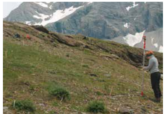
Vorbereitung von Aufnahmen für die Fotodokumentation. (AUE)