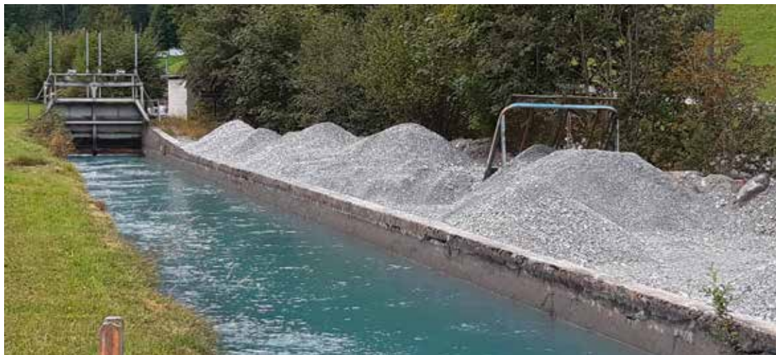
Im Rahmen der Geschiebesanierung sollen die Geschiebeentnahmen bei Kraftwerken mit baulichen oder betrieblichen Massnahmen vermindert werden. (AUE)